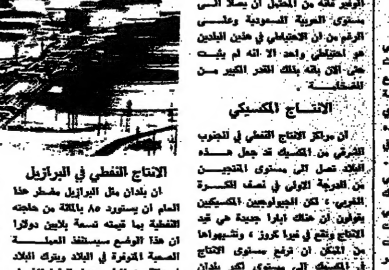
الانتاج النفطي في البرازيل

هناك بحث جئوني مستقيم من المصادر النفطية عبر اراضي نصف الكرة الغربي ، من الإسكا حتى تيرانيل فويجو تحفر الآلات السهول والجبال والاراضي المستقيمة بحثا عن الذهب الاسود الذي يقول الجيولوجيون انه تحت سطح الارض